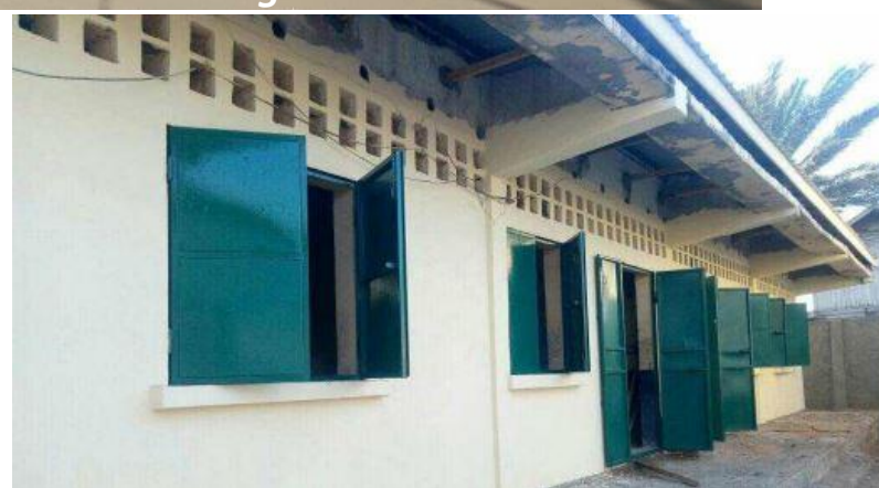
Réhabilitation de bâtiments d'enseignement dans les quartiers de Tsymaahavaobé et d'Ankisirasira Ville de Morondava - Madagascar