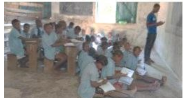
cours d'anglais au collège, avec des élèves de 6ème

Pour améliorer les conditions de l'ensemble de ces élèves, CODEGAZ met en œuvre un appel à dons pour une aide immédiate à la mise à disposition de tables bancs en quantité suffisante. Cette aide est estimée à 1300 euros.